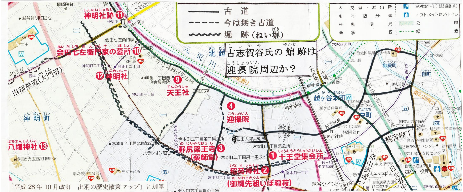
「平成28年10月改訂 出羽の歴史散歩マップ」に加筆