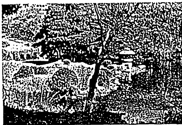
新宿御苑玉藻の池

日本庭園やフランス庭園、イギリス式自然風景園の整備も進み、明治三十九年五月、明治天皇を迎えて開園式が行われた。それ以降、ここは「新宿御苑」と名づけられ、皇室のバレス・ガーデンとなった。一般に公開されたのは、戦後、昭和二十四年になってからである。