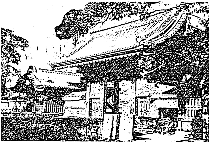
(東大赤門—御守殿門—)