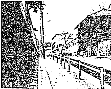
格子戸のある家（昭和五十一年）

この格子戸の家には小説のヒロイン日陰の女性お玉さんがいて、毎日散歩する岡田青年にひそかな好意を持つ。この情景をしのばせてくれるたった一軒の「格子戸の家」も昭和五五年には姿を消してしまった。