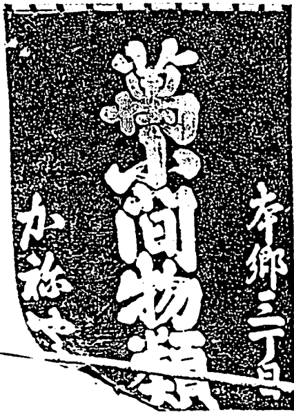
（老舗「かねやす」ののれん）

享保十五年三月（一七三〇）に池ノ端から出火した大火があり、湯島や本郷一帯が燃えた。町奉行の大岡越前守と諏訪美濃守は、再興家屋は本郷三丁目から南は耐火構造にするため、土蔵造り、塗屋とし、屋根は板や茅葺きを禁止し、瓦屋根にすることを命じた。それで、土蔵造りや塗屋の江戸の町並は本郷三丁目まで続いて、それから北の中仙道は、今まで通りの板や茅葺きの町屋であった。その境目の大きな土蔵造りの「かねやす」が目立ったものであろう。古川柳に「本郷もかねやすまでは江戸の内」とあるが、これは、江戸の姿がここではっきり途切れていたことをいっただけのものであろう。もつとも、町奉行における江戸とは、岩槻街道では駒込の先霜降橋、中仙道では西巢鴨のあたりまでが支配地であったようである。それで江戸の内、外の境は「かねやす」よりもっと北であった。