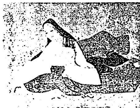
緋袴姿の春日局 (麟祥院蔵)

又、寺伝にいう、寛永五年三代將軍不予にあらせられたとき、局は自ら東照大権現の神前に詣で、若し今大故あるときは国家の安危にかかる。因って願はくば、妾が身を以ってこれに替り奉らん。若し恢復あらしめば忽ちに身に病苦を受け、誓って医薬を用ひずして死せんと云々。その忠誠に感応ありてか、日を経ず常にならせたもう。因って身を終るまで針灸薬餌を用ひずとある。同六年格に上り参内す。春日局の名を賜う。(江戸名所図会 麟祥院ヨリ)