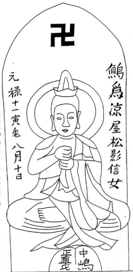
中島家「小曾川二六六」そば共同墓地

以上から私見ではあるが、「鳥八白」は印や記号では決してなく、「𪗈」という字であると思われるので、名称は「𪗈字（たんじ）」と呼ぶべきであると思うのである。