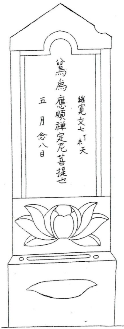
「應順禅定尼の為に鴿（ついで）む菩提也」