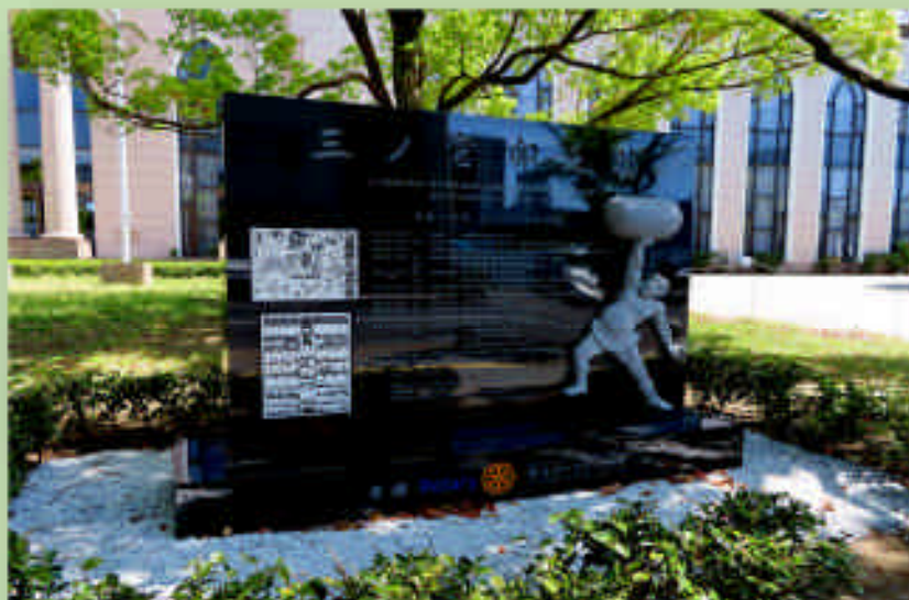
越谷市中央市民会館前庭の「三ノ宮卯之助顕彰碑」