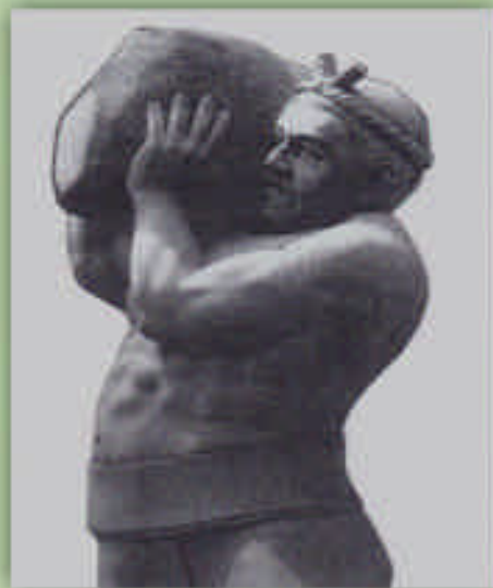
魚吹八幡の卯之助石像

なお、その後の卯之助一座の足取りは不明です。現在、魚吹八幡では地元の人によって石像が設置され、足元には卯之助の力石が置かれています。